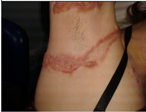
A – Antes da aplicação BTX A